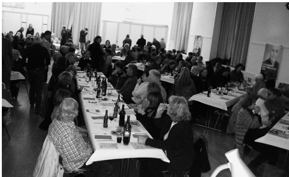
Der wie immer sehr gut besuchte Anlass «Risotto und rote Geschichten».