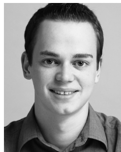
Von Thomas Lanz

Ungefähr seit Mitte 2009 laufen bereits die Vorbereitungen für den Gemeinderatswahlkampf. Nicht weniger als 18 JUSOs kandidieren 2010 auf den SP-Listen in den verschiedenen Wahlkreisen. Unsere Wahlkampfgruppe begann deshalb schon früh damit, Postkarten, Flyer, Velosattelüberzüge und Kleber zu entwerfen sowie verschiedene Aktionen zu planen. Wir hoffen natürlich, den Wahlkampf der SP mit unserem Engagement optimal zu ergänzen.