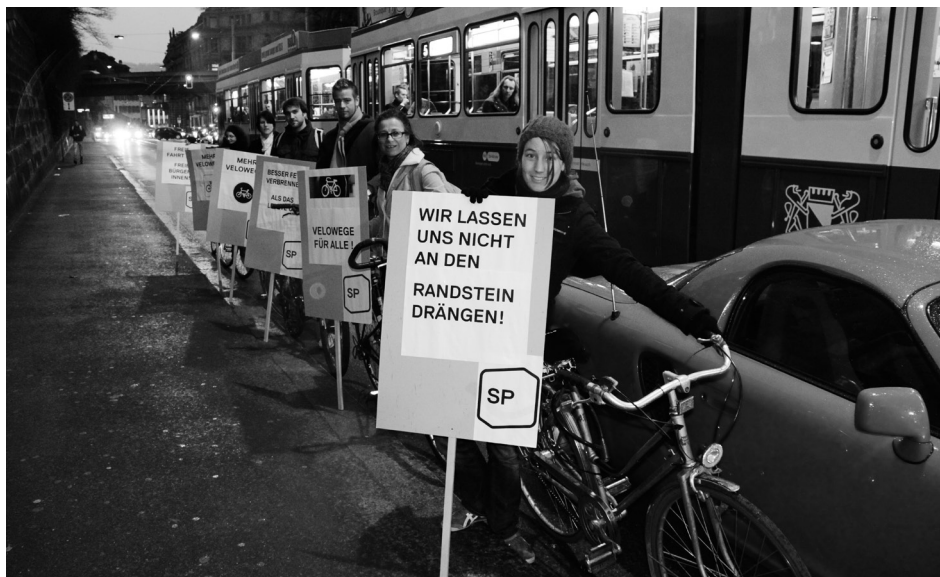
Wahlkampfaktion für ein sicheres und durchgehendes Velonetz in Zürich

Wir freuen uns, mit allen Genoss/innen der SP Stadt Zürich in ein neues politisches Jahr zu starten. Wesentlich ruhiger soll es nicht werden, denn wir werden die breite Diskussion zu Themen, die in der Partei kontrovers besprochen werden, aktiv aufgreifen. Wir wollen weiterhin eine laute und vernehmbare Stimme in Zürich sein und uns gleichzeitig intern stärken und wo nötig verändern. Unsere Erfahrung mit euch in den letzten Monaten hat uns gezeigt, dass wir bestens aufgestellt sind, die Herausforderungen anzunehmen und anzugehen. Wir freuen uns auf diese Zusammenarbeit mit euch!